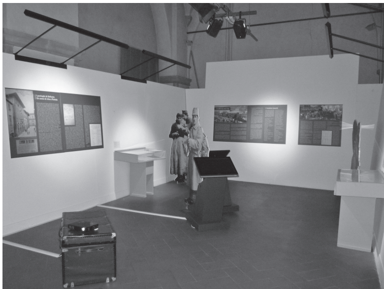
Sala 3. Gli esuli della Grande Guerra