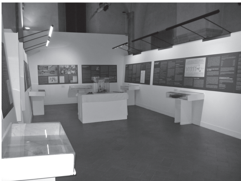
Sala 4. Pistoia nella Grande Guerra