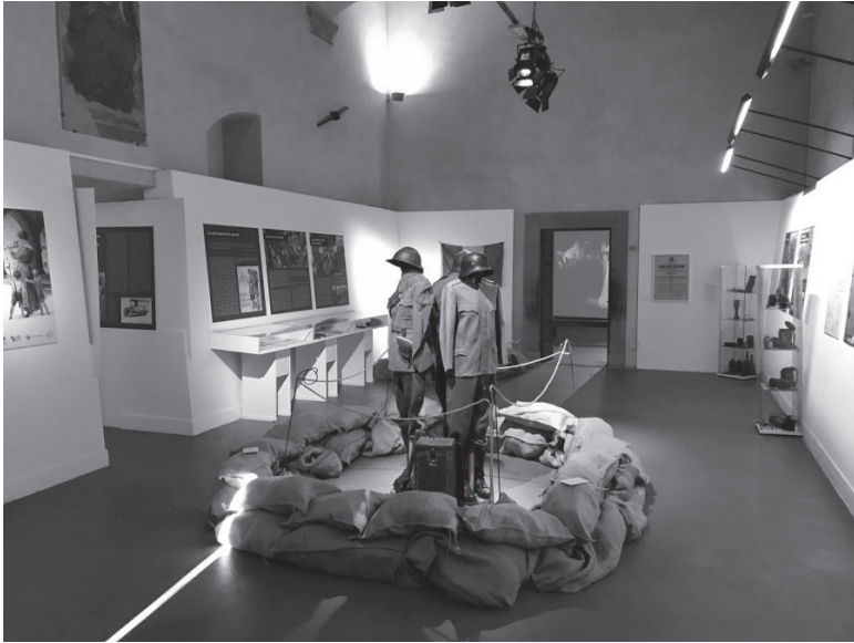
Sala 1. Combattere la guerra

ricavate da semplici panche, poste innanzi alla proiezione del filmato Il cinema racconta la guerra 11 , della durata complessiva di 15 minuti, che illustrava l'intera storia bellica servendosi di scene tratte da film muti e sonori. In questo modo, il visitatore poteva ripercorrere le fasi salienti del primo conflitto mondiale e, al contempo, avere un assaggio delle opere cinematografiche di registi di tutto il mondo. Inoltre, il filmato mostrava come nell'arco di pochi anni si fosse passati da film propagandistici, che offrivano al pubblico una visione illusoria del conflitto, a opere cinematografiche attente a narrare la guerra in tutta la sua crudezza. La sala era arricchita da una serie di pannelli sulla produ-