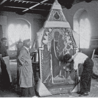
UNA OPERA... dipinto di un artista...