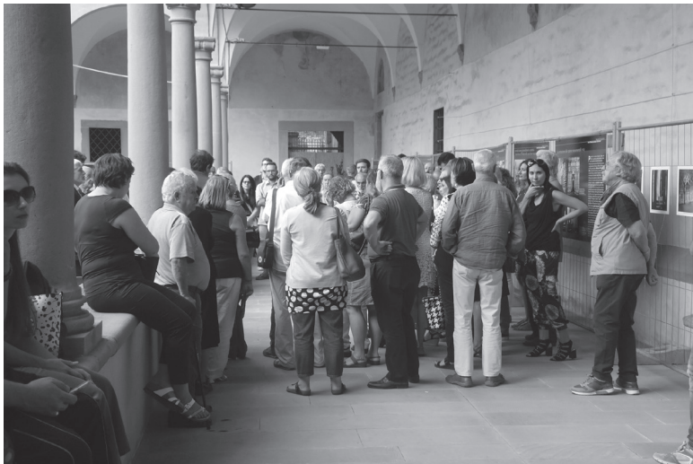
Un momento dell'inaugurazione