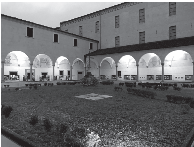
L'allestimento all'interno del Chiostro di San Lorenzo a Pistoia